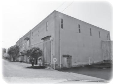
乙辺浄化センター