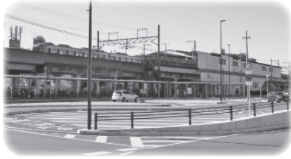
星田駅北側ロータリー