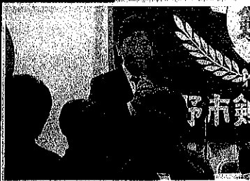
文化体育団体でのあいさつ