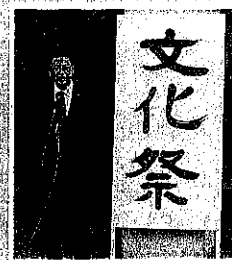
交野市文化祭後援会の行事等