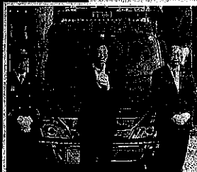
消防団のポンプ車入魂式