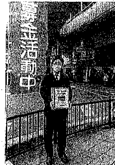
ウクライナ支援の募金活動