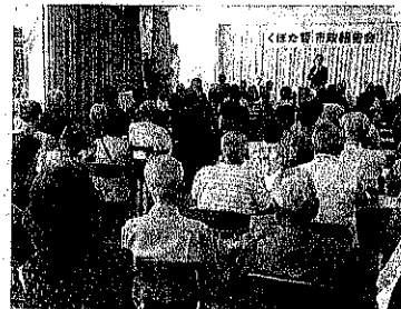
市政報告会を開催