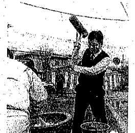
地域行事で餅つき