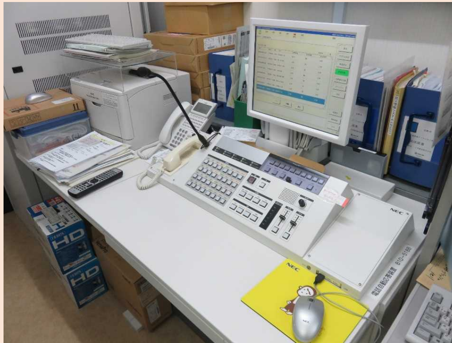
防災行政無線同報系操作卓