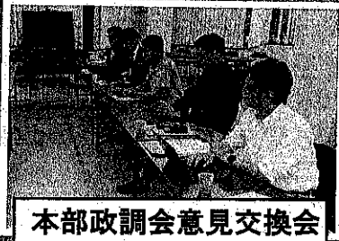
本部政調会意見交換会